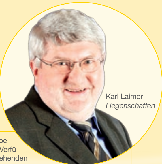
Karl Laimer Liegenschaften