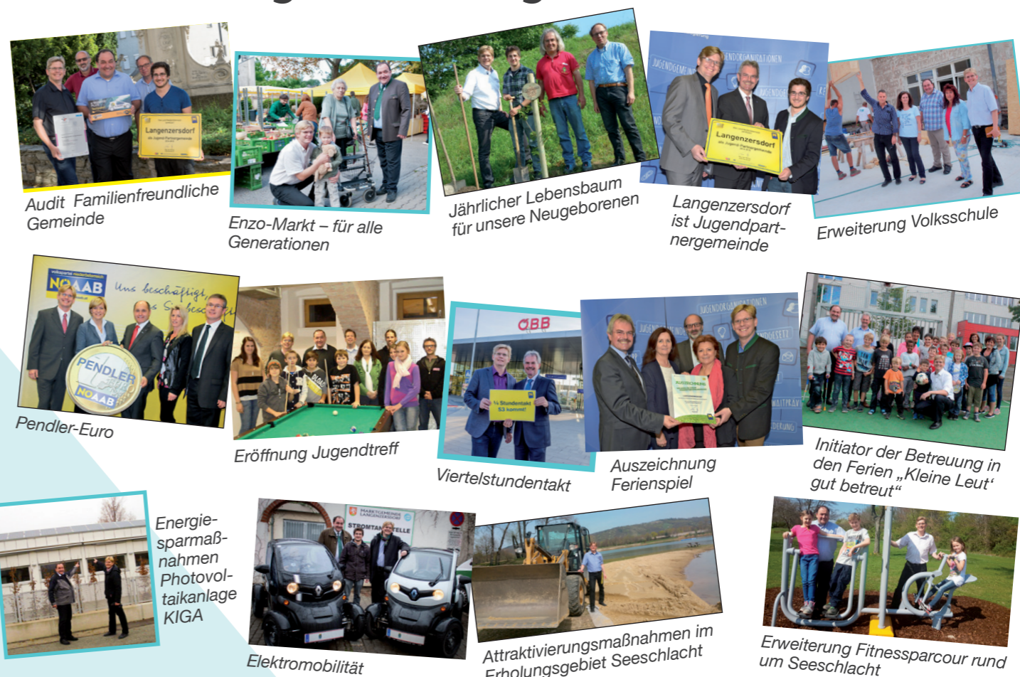
Audit Familienfreundliche Gemeinde