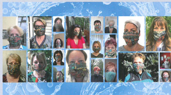
Die ÖVP Frauen Langenzersdorf setzen weiterhin auf Masken.

Maske auf: Wir ÖVP FRAUEN Langenzersdorf tragen den Nasen-Mund-Schutz solange es notwendig ist! Der Nasen-Mund-Schutz ist vom Regelfall zur Ausnahme geworden.